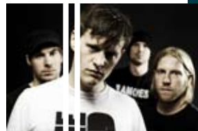
Keine Unbekannten mehr sind TURBINE WEST-STADT: 70er Rock'n'Roll trifft funky Grooves und schnodderige Lyrik.