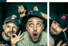
Aus Meerbusch kommen MASSENDEFKAT ange-reist, die mit ihrer neuesten Platte auch glatt in die Media Control Newcomer Top 20 eingestiegen sind: Rock, Pop, Punk.

Weiter geht's auf der Aftershowparty im Unikeller: Sahis lehrt uns, wie Rap aus Cannakale aussieht, und das Osnabrücker Rock/Hip-hop-Urgestein X-Sidaz legt nachher noch einen drauf.