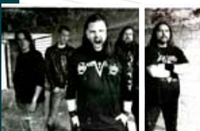
BITTER PIECE aus heimischen Gefilden sagen dagegen: „Scheißegal, Hauptsache Metal!“