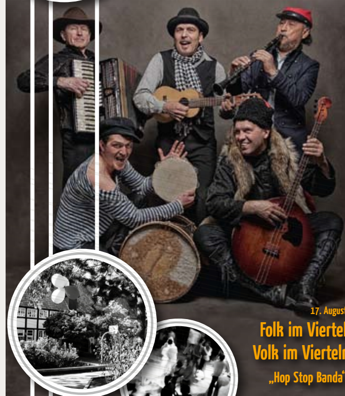
17. August Folk im Viertel Volk im Viertel „Hop Stop Banda“